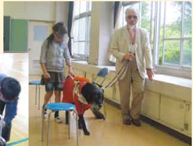
▼福祉実践教室(盲導犬)