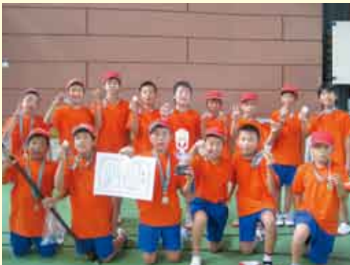
▶男子の部優勝(学戸A)

最後に、この大会にご協力をいただきました体育指導委員さんや地区スポーツ推進員さんを始め関係者の方々に、心より厚くお礼申し上げます。