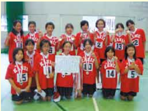
▶女子の部優勝(蟹江A)