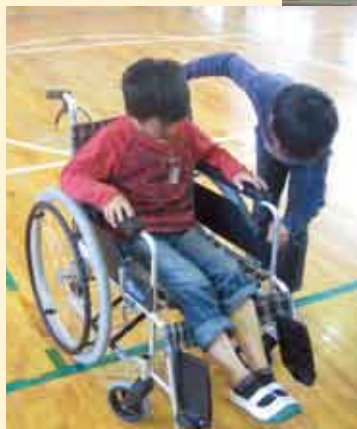
◀福祉実践教室(車椅子)