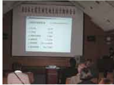
▲第1部 被災地支援活動報告