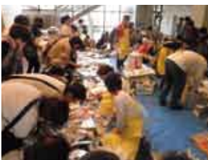
▲悪天候により、町公民館内ロビーで開催しました。