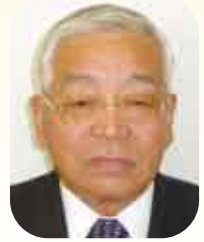
蟹江町社会福祉協議会会長