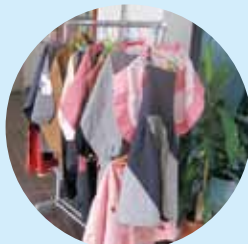
▲かわいいエプロンも即完売しました。

バザー開催に向けて多くの方が「不要なもので福祉のためになれば」と物品を寄付してくださいました。バザーにお越しいただいた方を始め、物品の値付け・梱包・物品の販売にご協力いただきました「かにえボランティアサークル」の皆さまに厚くお礼申し上げます。