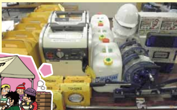
▲発電機、ヘルメット、バール、投光器など