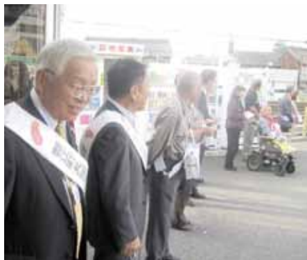
▲近鉄蟹江駅での街頭募金

第66回を数える赤い羽根共同募金運動が昨年10月より3ヶ月間実施されました。 皆さまからお寄せいただいた募金は658万余円となりその全額を愛知県共同募金会へ納付いたしました。来年度に交付される配分金で蟹江町の福祉増進のために活用させていただきます。 この運動にご協力くださいました町民の皆さま、並びに関係団体の役員の方々に厚くお礼申し上げます。