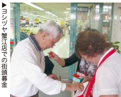
▶ヨシツヤ蟹江店での街頭募金

蟹江町長寿会連合会 蟹江町身体障害者福祉会 蟹江町遺族会 蟹江町母子福祉会 蟹江町心身障害児者保護者会 蟹江町保護司会 蟹江町民生委員児童委員協議会 蟹江町婦人会 蟹江町仏教会 蟹江町再生素源回収組合 蟹江町医師会 蟹江町議会議員互助会 蟹江青果物納入組合 日本ボーイスカウト愛知連盟蟹江第一団 蟹江町立保育所保護者会 はばたき保育園 蟹江学区子ども会 舟入学区子ども会 学戸学区子ども会 蟹江町ゲートボール協会 自主防犯組織フクロウ隊