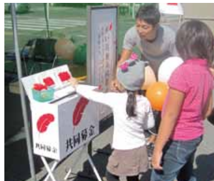
▲町民まつりにてPR活動

第66回を数える赤い羽根共同募金運動が昨年10月より3ヶ月間実施されました。 皆さまからお寄せいただいた募金は658万余円となりその全額を愛知県共同募金会へ納付いたしました。来年度に交付される配分金で蟹江町の福祉増進のために活用させていただきます。 この運動にご協力くださいました町民の皆さま、並びに関係団体の役員の方々に厚くお礼申し上げます。