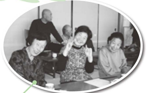
カメラの前でニコッ!! 参加者の皆さま、とても素敵な笑顔をみせてくれます。

家に閉じこもることなく、この会食会へお出かけいただき、他の参加者や協力員の皆さまと交流し笑顔で翌月もお会いできれば嬉しいです。