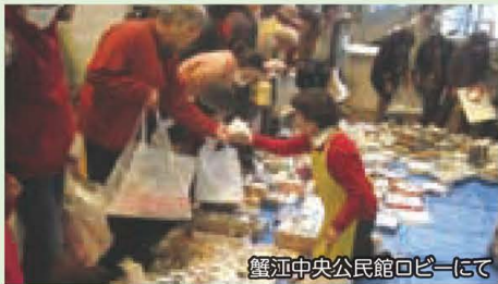
蟹江中央公民館ロビーにて