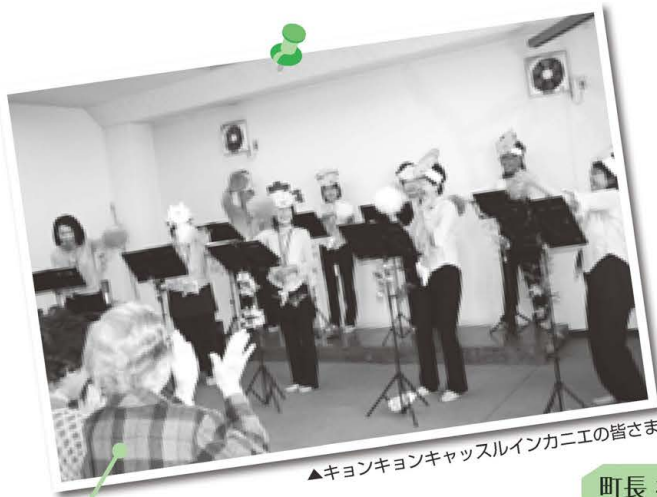
▲キョンキョンキャッスルインカニエの皆さま

今回は、オカリナ演奏をご披露いただきました。体操も取り入れてくださり、楽しく認知症予防！