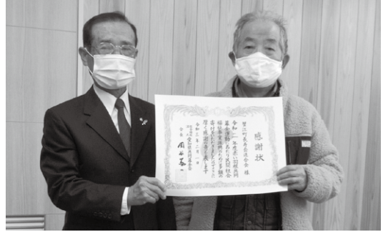
長寿会連合会様へ大口寄付の感謝状を贈呈しました。

●大口のご寄付をいただいた方へ感謝状を贈りました。7万円以上の多額ご寄付をいただいた法人・団体の皆さまに対して、県共同募金会長からの感謝状の伝達を行いました。