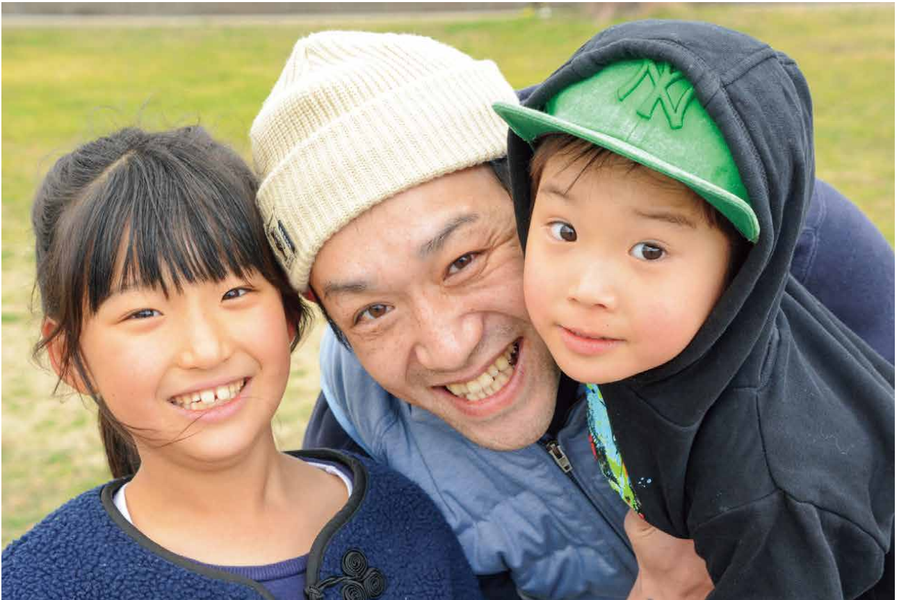
佐屋川創郷公園にて