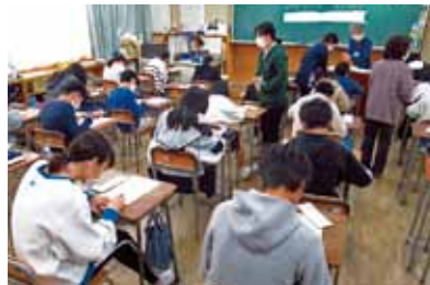
点字 蟹江小学校6年生