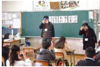
手話 新蟹江小学校5年生