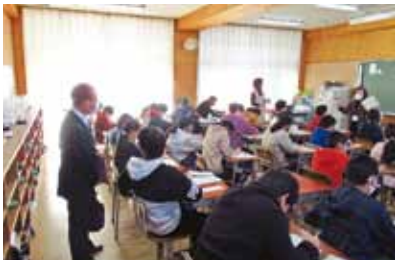
点字 学戸小学校5年生