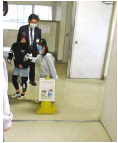
ガイドヘルプ 舟入小学校4年生