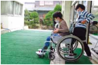
車椅子 舟入小学校3年生

今年度は新型コロナウイルス感染症対策を行い、4校で実施することができました。(令和5年2月現在)。参加児童は学年ごとにそれぞれ「点字」「手話」「盲導犬」「車椅子」を体験しました。