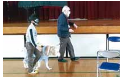
盲導犬 舟入小学校4年生