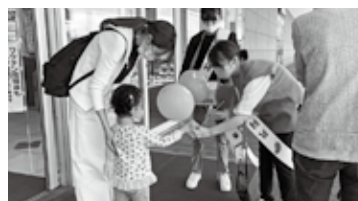
▲街頭募金の様子 今年度より中学生にも協力してもらい実施しました。